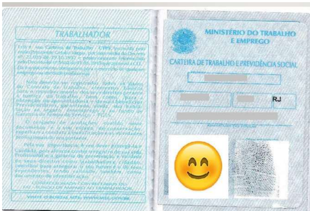
FOLHA DE IDENTIFICAÇÃO página com foto

Cópia digitalizada da Carteira de Trabalho e Previdência Social (CTPS) com folhas de identificação: página com foto e verso (Qualificação civil) e última anotação de trabalho (página cujo título é Contrato de Trabalho) e página seguinte em branco ou Carteira de Trabalho Digital atualizada.